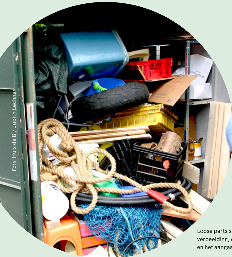
Loose parts stimuleren de verbeelding, de creativiteit en het aangaan van risico's

Als begeleider hebben we eigenlijk maar drie taken. Ten eerste: we zijn er voor hulp en ondersteuning als het kind daarom vraagt. Meespelen mag, maar we proberen ons ook zo snel mogelijk weer terug te trekken zodat kinderen zelf spelen. De tweede taak: de veiligheid. Niet alles hoeven wij aan het kind over te laten. Tegen gevaar beschermen we kinderen en dan grijpen we in. Gevaarlijk zijn dingen die kinderen niet zien of kunnen